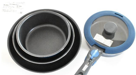
着脱式フライパン4点セット